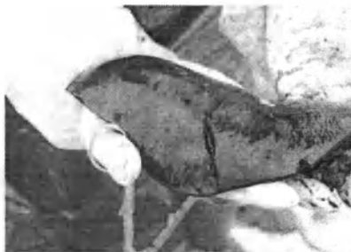
Збільшена в декілька разів селезінка свині при АЧС