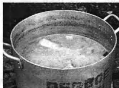
Харчові відходи згодовувати свиням обов'язково тільки після кип'ятіння !

У разі підтвердження спалаху захворювання, служба ветеринарної медицини проводить карантинні заходи по