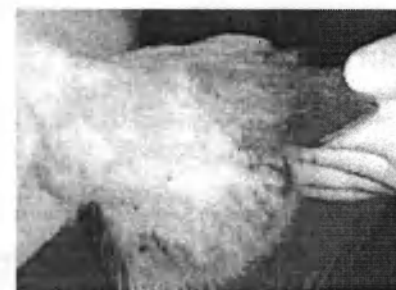
Крововиливи на шкірі вушних раковин