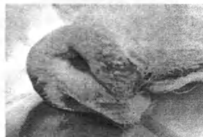
Крововиливи на слизовій п'ятачка