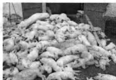
Загибель великої кількості свиней