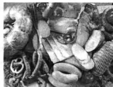
В м'ясних продуктах вірус АЧС зберігається до 6 місяців !