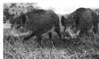
Європейський дикий кабан